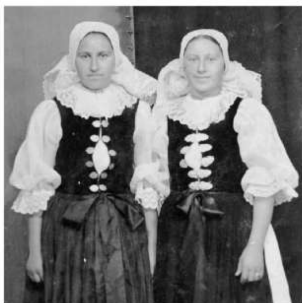
Dievky v ručníkoch, Košariská, 2. tretina 20. storočia