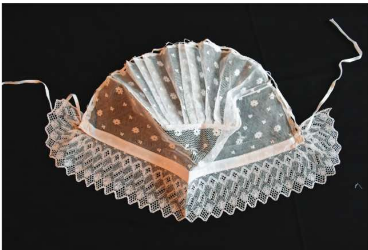
Čiastočne rozložený čapec , Košariská

Čapec žehlíme z rubovej strany, začíname od čelenky. Čipku a čelenku rozprestrieme na plachtu a čipku prstami vyrovnáme. Je potrebné označiť si stredný zúbok, pretože od neho sa v prípade čapcov z Velkej Myjavy odvíja zatočenie čipky na krajoch a mal by byť v jednej rovine s výšivkou na čelenke (ak ju čapec má).