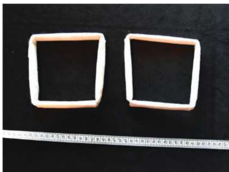
Papierová konštrukcia na copki , Košariská, koniec 20. storočia

Pod ručník aj čapec sa nosil rovnaký typ účesu – copki –, ktorý sa v oblasti mierne líšil. Účes závisel od hrúbky, dĺžky a kvality vlasov. Ak bolo vlasov na copki dosť, podložky sa nedávali. Ak ich bolo menej, tak sa dopĺňali. Podľa hustoty vlasov sa na udržanie tvaru ručníka alebo čapca na hlave používali aj „umelé“ copki . Umelé copki mohli byť z drevok, povriesel, papiera, drôtu obmotaného gázou a vytvárané tak, aby vytvárali štvorec. Dôležitý je štvorcový tvar finálneho účesu, vďaka nemu ručník ostane na mieste i bez množstva sponiek a udrží si aj svoj tvar.