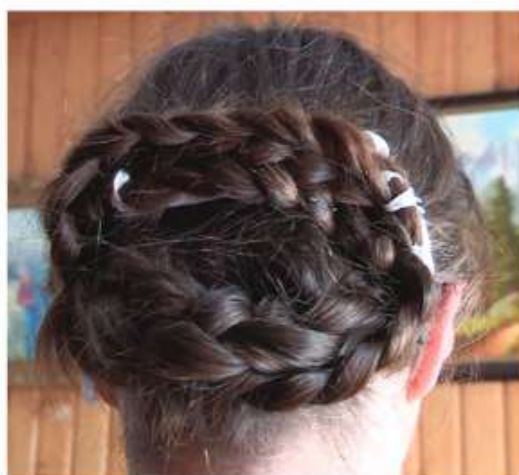
Dievčenský účes, rekonštrukcia, Vrbovce, 2016