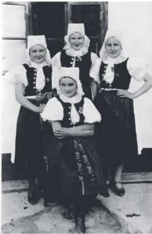
Dievky vo sviatočnom odevu, Vrbovce, 2. tretina 20. storočia

Odev na slávnostné a obradové príležitosti pozostával z tylangrového ručníka alebo čapca lemovaného tylovou paličkovanou čipkou, z rubáča , rukávco, prucla , kasanice a fertuchy.