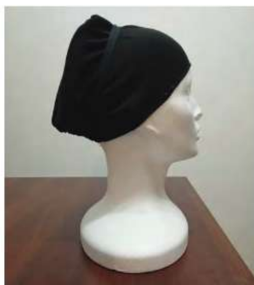
Šlochana – spodná pokrývka hlavy

Pre súčasné potreby folklórnych kolektívov a rýchleho prezliekania na vystúpeniach odporúčame namiesto copkov plošný drdol v strede temena. Základným účesom je jeden alebo dva vrkoče bez vrchnej gumičky – bola by príliš vystúpená, čím by deformovala zadnú stranu ručníka alebo čapca. V prípade potreby je možné účes zafixovať aj spodnou pokrývkou hlavy, ktorú možno vyrobiť. Šlochana je vyrobená z plátna, pokrýva celé vlasy a na temene má výstuž z umelých copkov . Upevňuje sa šnúrkou, ktorá sa omotá okolo hlavy a uviaže na zátylku. Šlochana sa v tradičnom prostredí nepoužívala. V súčasnosti sa používa ako pomôcka pod ručník alebo čapec, ako aj pri samotnom viazaní ručníkov.