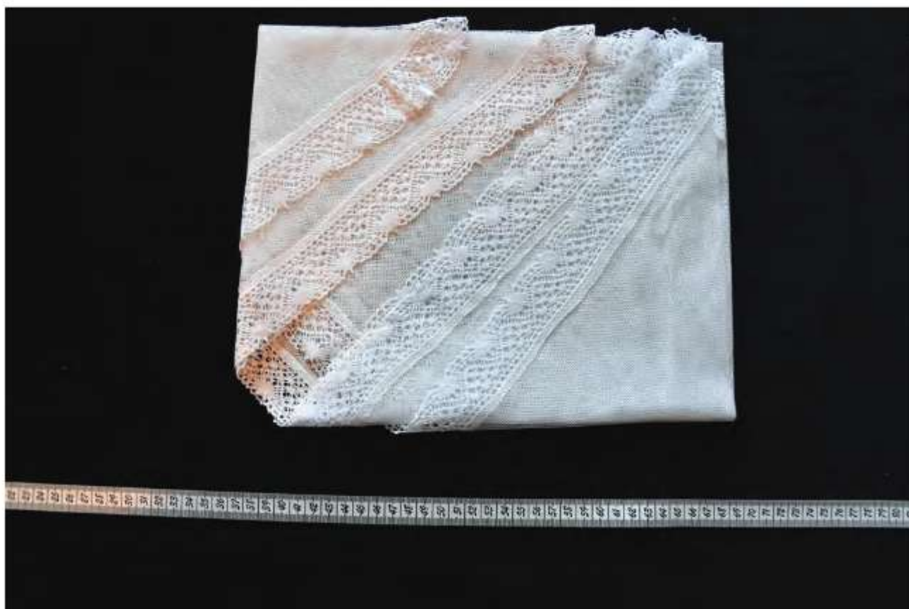
Postup skladania ručníka 4