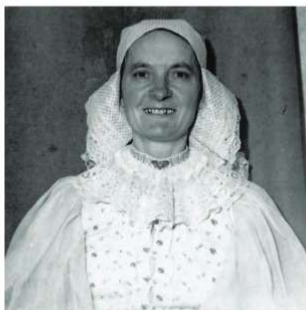
Žena v ručníku, Krajné, 2. tretina 20. storočia