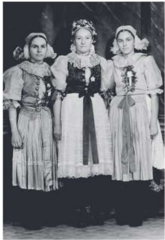
Nevesta (v strede) s družicami, Rudník, 50. roky 20. storočia

K pracovnému odevu na všedný deň nosili slobodné dievky aj ženy kvietačkoví ručník. Na ručníku mohla byť prišitá 2-3 cm krajka . Ručník pre slobodné a mladé ženy bol bledších farieb, pre staršie ženy tmavších farieb. Vzory na ručníkoch a ich farebnosť sa v myjavskej oblasti mierne odlišovali. Vo Vrbovciach a na ich kopaniciach sa nosili ručníky s výraznejšími farbami ako v ostatných častiach regiónu.