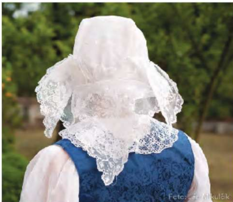
Dievka v ručníku, FS Brezová, 2017.