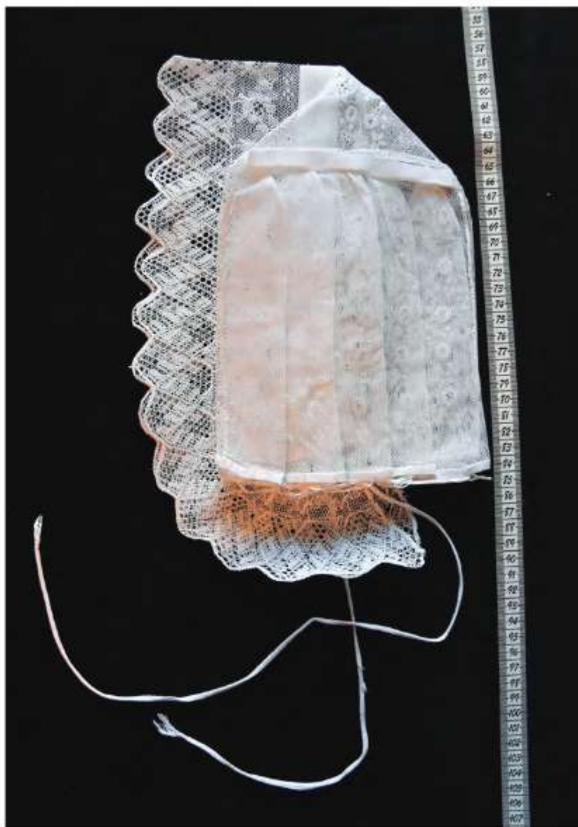
Zložený čapec , Košariská

Takto poskladaný čapec sa samostatne dosuší na plechu na radiátore alebo peci. Do vyžehleného a naskladaného čapca navlečíeme šnúрку a uložíme ho napríklad do krabičky na rovnú plochu. Ak sú nitky na prevliekanie šnúrky prilepené škrobom, jemne ich oddelíme vlhkými rukami.