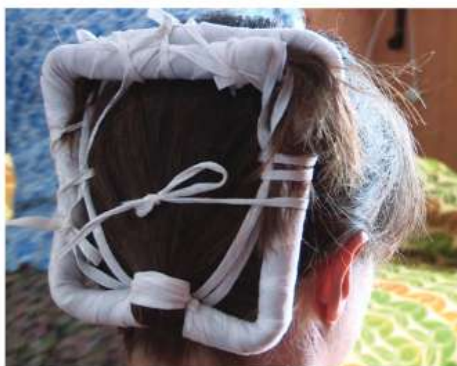
Ženský účes, rekonštrukcia, Vrbovce, 2016