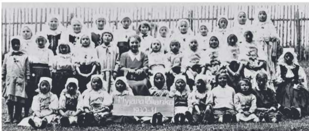
Žiaci školy na myjavských kopaniciach (Polianka), školský rok 1930/1931

Kvietečkové ručníky používané na bežný deň sa v niektorých prípadoch nemuseli škrobiť, vtedy sa uviazali pod bradou na bačku alebo sa preložili okolo hrdla a uviazali na zátylku. Takto ich nosili aj školopovinné deti.