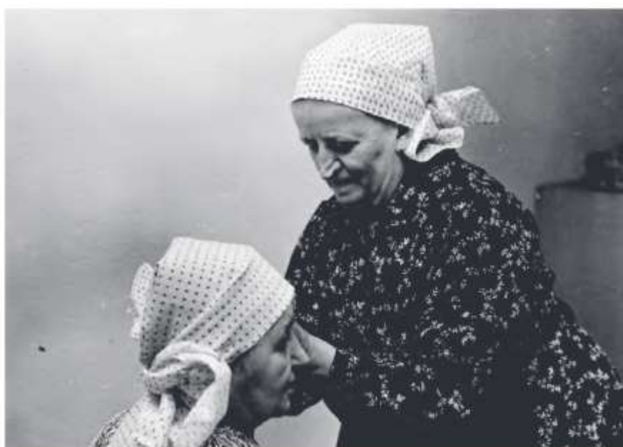
Uvazovačka pri viazaní ručníka, Myjava, okolo roku 1970, Múzeum Slovenských národných rád