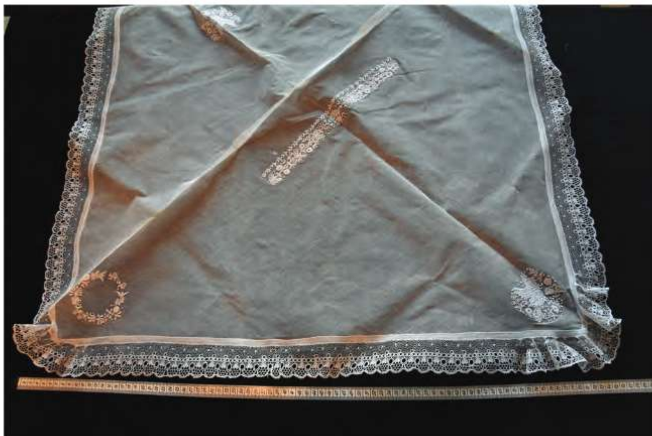
Postup skladania ručníka 1