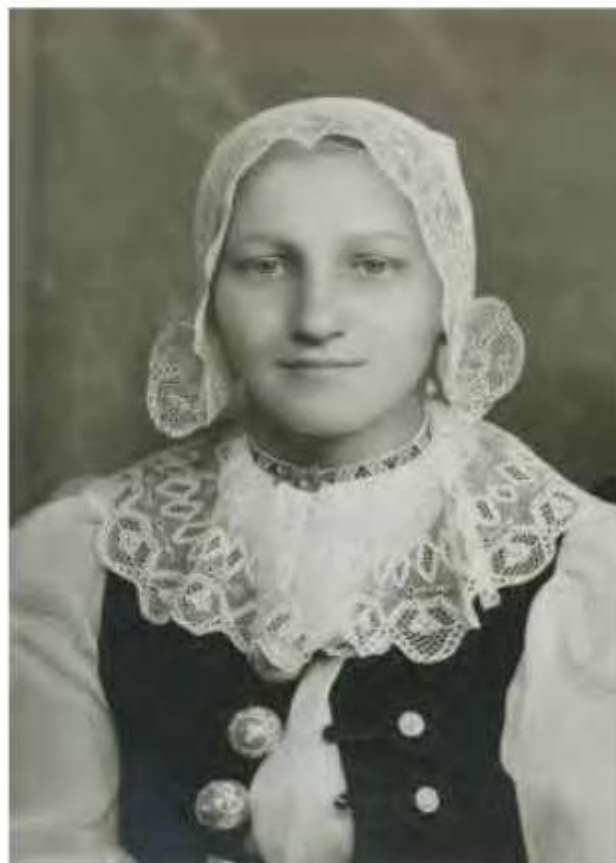
Žena v čapci , Jablonka, 2. tretina 20. storočia