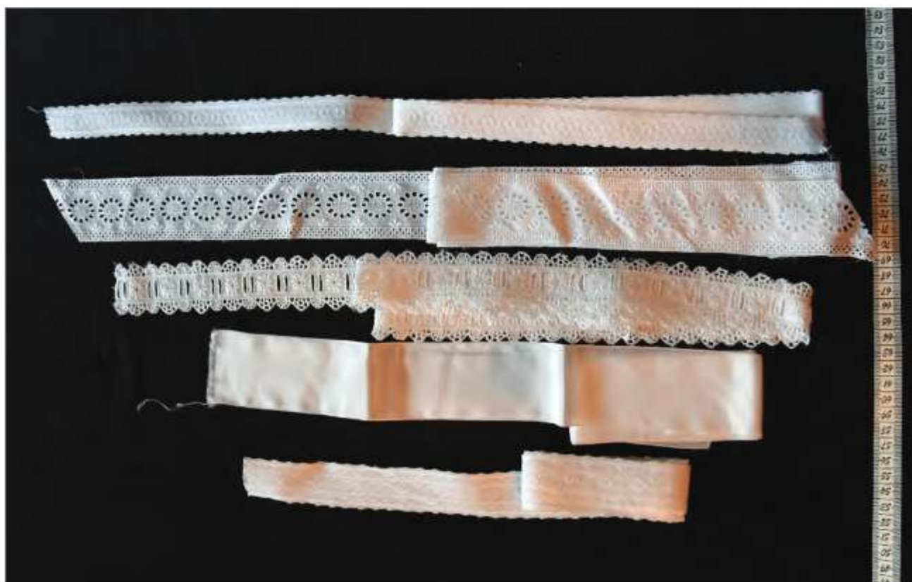
Stuhy na čapec , Košariská

Čapec sa zhotovoval z bieleho tylu. Mladšie ženy nosili čapec vyšívaný na predničke (tylová časť nad čipkou) a dienku bielou niťou. Čím bola žena mladšia, tým mala na predničke prišitú širšiu čipku (vravelo sa, že mladej žene tesne po sobáši staršie ženy túto čipku sťahovali hlboko nad čelo, aby vraj nepozerala za inými mužmi). Staré ženy nosili čapec nevyšívaný a s užšou čipkou. Bohaté ženy nosili čipku širšiu a drahšiu. Čapec sa zdobil okolo dieňka kupovanou bielou vyšivkou alebo hladkou bavlnenou stuhou. Jej dĺžka bola približne 2,5 – 3 m. Pod dieňkom sa zaviazala na menšiu mašľu a jej konce viseli až do polovice chrbta alebo po pás (podľa dĺžky stuhy). Dieňko čepca bolo zdobené výšivkou. Mladé a majetné ženy mali výšivku bohatú, staršie a chudobnejšie ženy menej bohatú. Čepce na obdobie smútku alebo pre staré ženy boli bez výšivky.