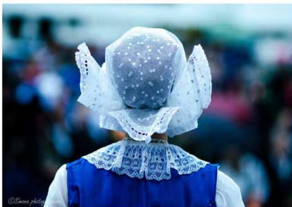
Dievka v ručníku, FS Kopaničiar, 2017. Uchá viazané nahor pre potreby FS.