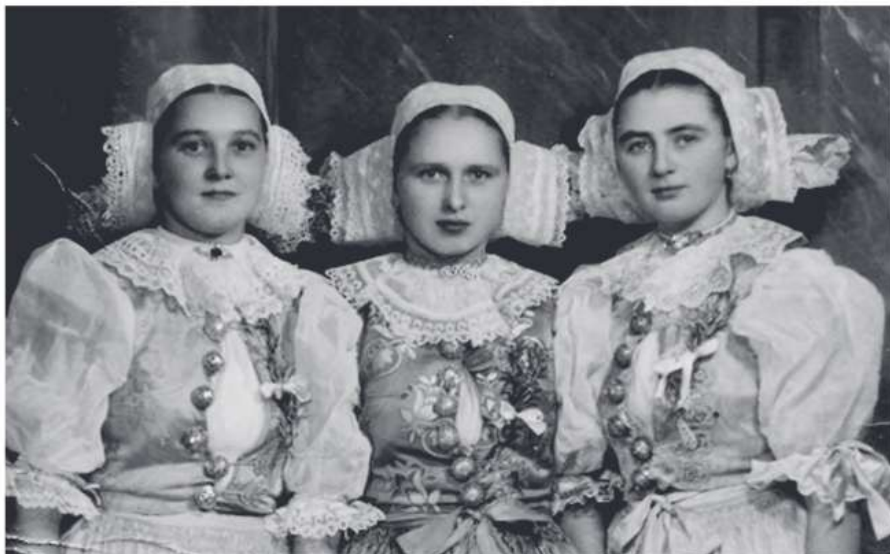
Družice, Rudník, 50. roky 20. storočia