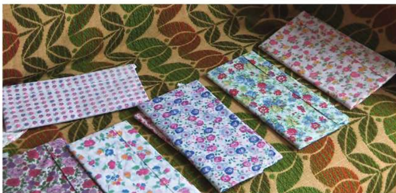
Pracovné ručníky, Vrbovce, 20. storočie