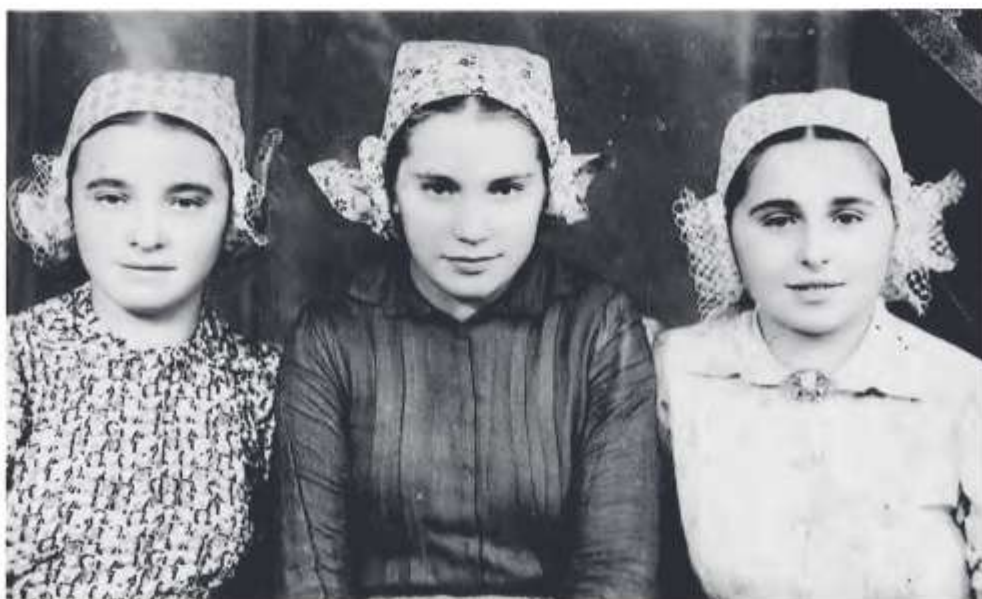
Dievky v odevu na všedný deň, Brestovec, 2. tretina 20. storočia