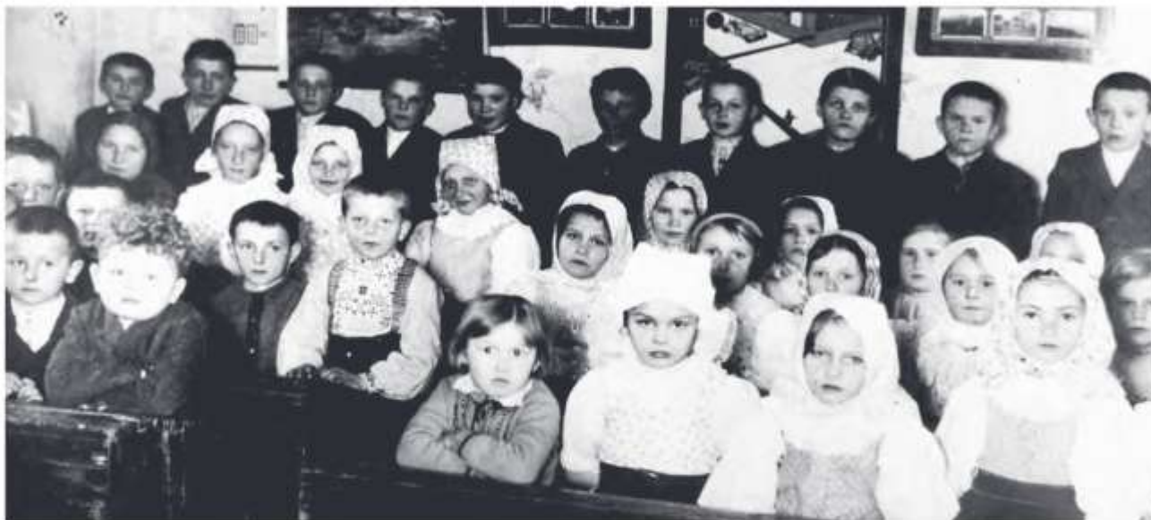
Žiaci školy na myjavských kopaniciach (Poriadie), nedatované

Batoľatá a najmenšie deti do 1 roka nosievali na hlave zdobený čepček. Dievčatá nosili na bežný deň vlasy učesané do dvoch vrkočov, ktoré mohli byť ďalej upravené ako copki . Naviazaný ručník nosili dievčatá na sviatočné príležitosti aj do školy. Nosili aj nenaškrobené ručníky, preložené okolo hrdla a uviazané v zadnej časti krku alebo pod bradou.