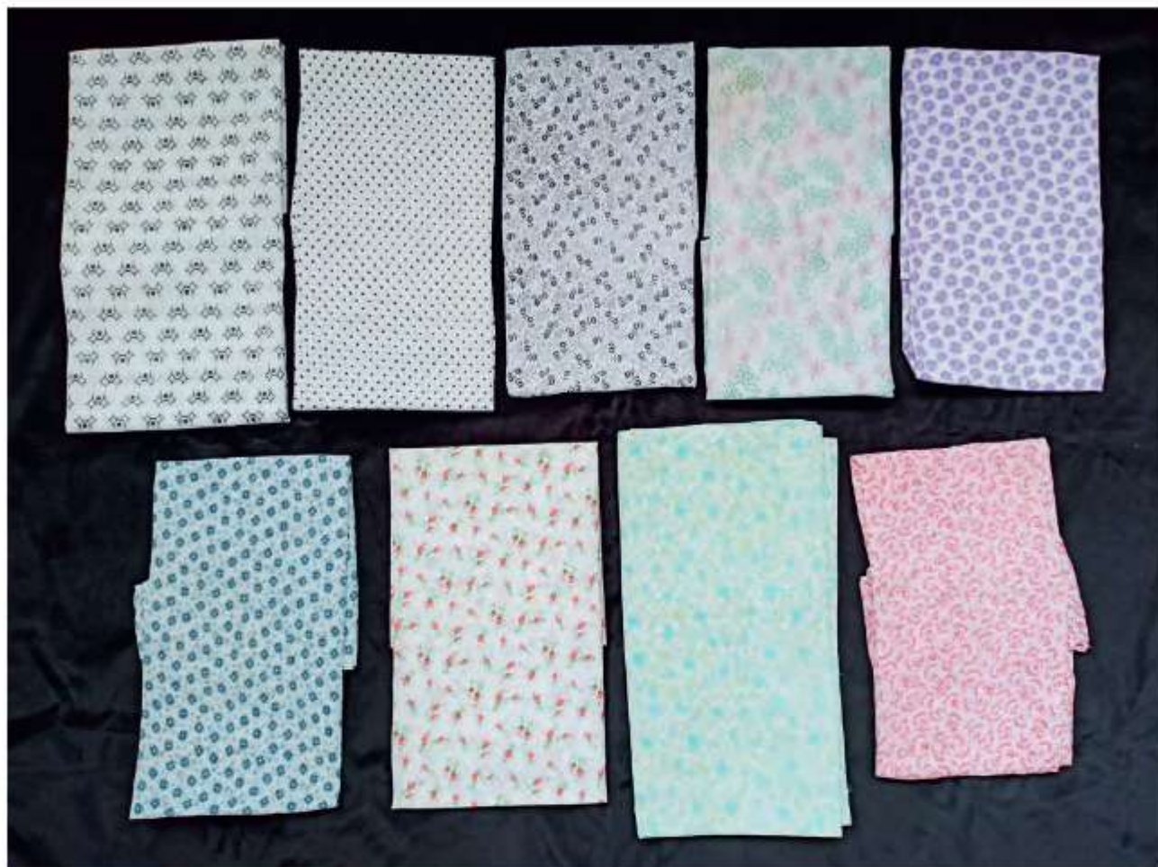
Pracovné ručníky, Velká Myjava, 20. storočie