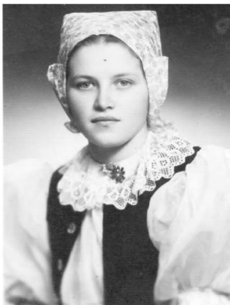
Dievka v ručníku, Vrbovce, nedatované