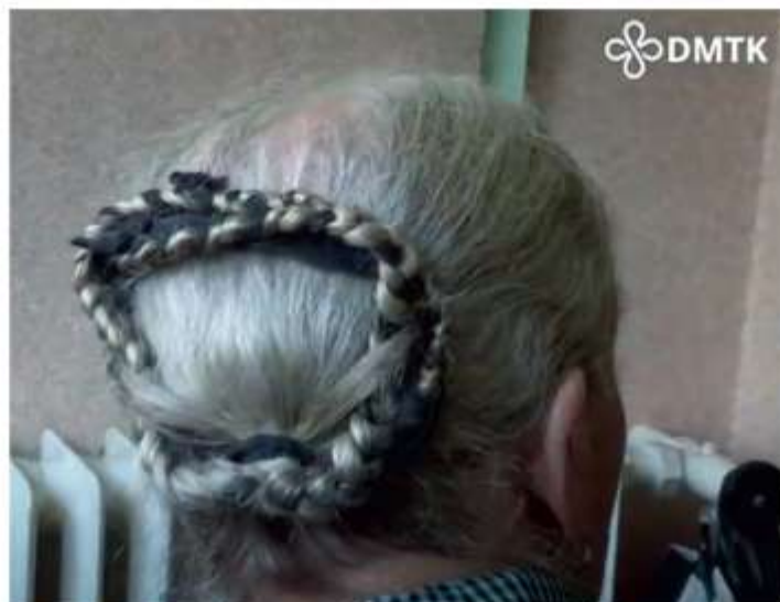
Ženský účes, Brestovec, 2016