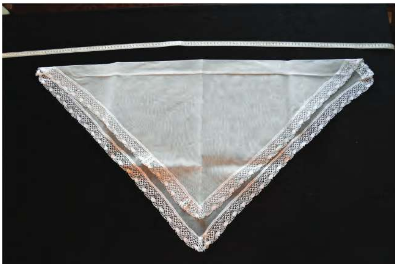
Postup skladania ručníka 2