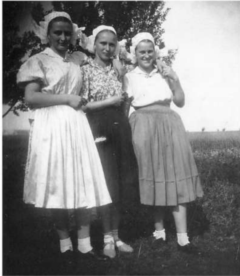
Dievky v odevu na všedný deň, Rudník, 40. roky 20. storočia

Typ ručníka, resp. materiál použitý na jeho výrobu, závisel od typu odevu, ku ktorému sa nosil. K odevu na bežný deň či zábavu sa nosili kvietkové ručníky. Takýto odev na bežný deň pozostával z rubáča , rukávco v , prucla , zo sukne a z ručníka. Od druhej tretiny 20. storočia sa rukávce a prucl začali nahrádzať blúzkami zo vzorovanej bavlny.